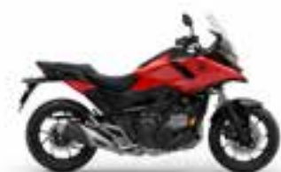
Fighting Red Novinka