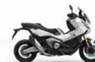
Pearl Glare White Novinka