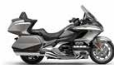
Beta Silver Metallic Iridium Gray Metallic