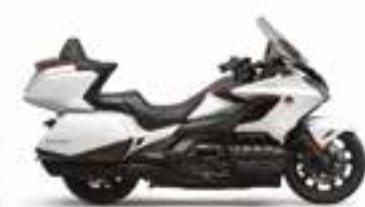
Pearl Glare White