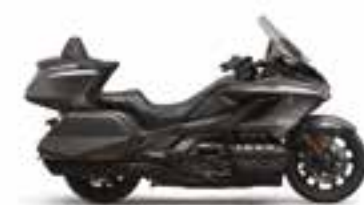
Heavy Gray Metallic-U