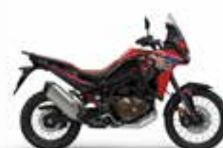
Grand Prix Red Novinka