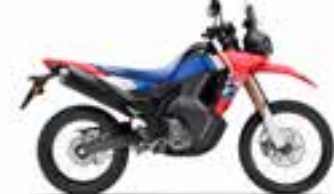
Extreme Red Novinka