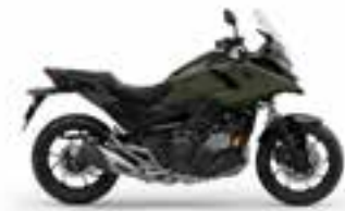
Eco Ivy Ash Green R Novinka