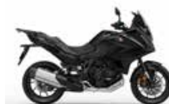
Gunmetal Black Metallic Novinka