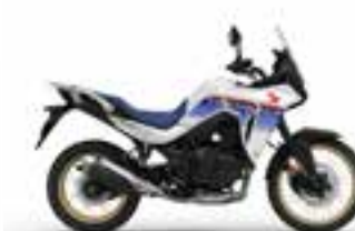
Ross White Novinka