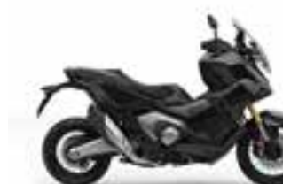
Graphite Black Novinka