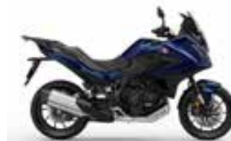
Pearl Hawkseye Blue Novinka