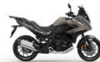
Mat Warm Ash Metallic Novinka