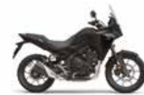
Mat Gunpowder Black Metallic