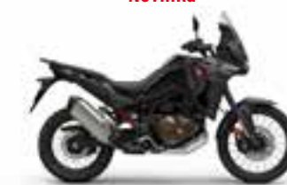
Mat Ballistic Black Metallic Novinka