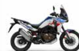
Pearl Glare White (ES Model Only) Novinka