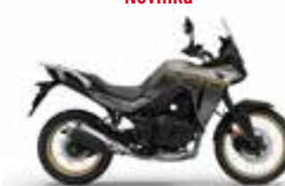
Pearl Deep Mud Gray Novinka