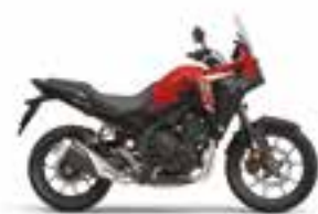
Grand Prix Red