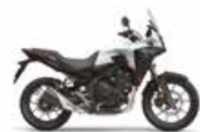
Pearl Horizon White