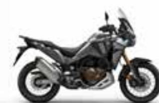
Mat Iridium Gray Metallic Novinka