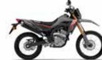
Swift Gray Novinka