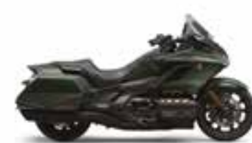
Mat Armored Green Metallic