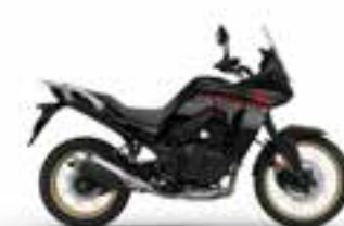
Graphite Black Novinka