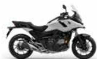
Mat Pearl Glare White Novinka