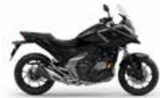
Eco Black R Novinka