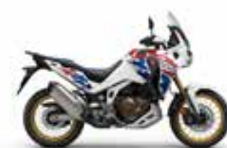
Pearl Glare White Novinka