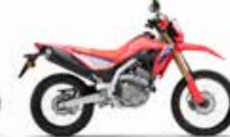
Extreme Red Novinka