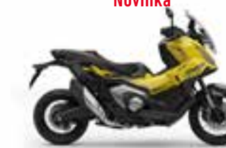
Mat Goldfinch Yellow Novinka - Special Edition