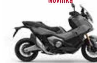
Mat Deep Mud Gray Novinka