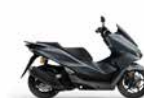
Mat Dim Gray Metallic Novinka