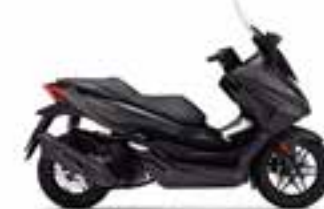
Mat Cynos Gray Metallic Novinka