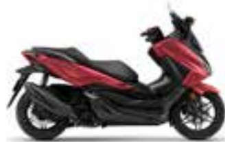
Carnelian Red Metallic Novinka