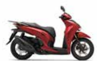
Mat Pearl Diaspro Red Novinka · Special Edition