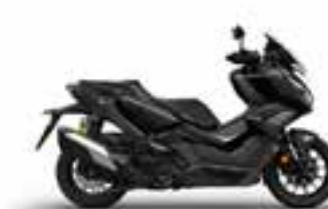
Pearl Nightstar Black Novinka