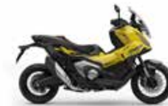
Mat Goldfinch Yellow Novinka - Special Edition