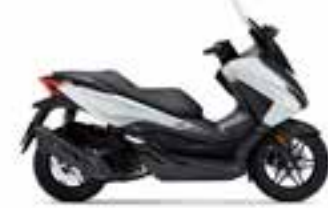
Mat Pearl Cool White Novinka