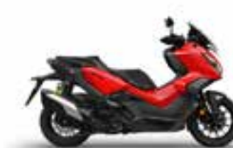
Hyper Red Novinka