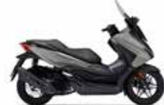
Pearl Falcon Gray Novinka