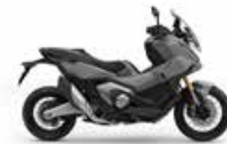
Mat Deep Mud Gray Novinka