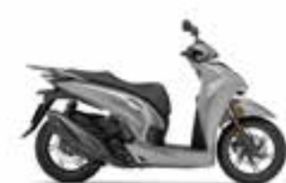
Mat Lucent Silver Metallic Novinka