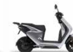
Digital Silver Metallic