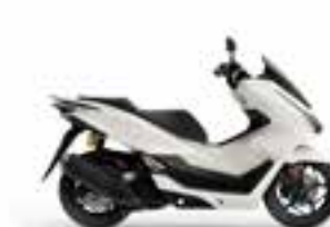
Pearl Snowflake White Novinka