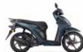
Mat Suit Blue Metallic