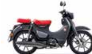
Mat Axis Grey Metallic