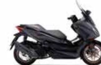
Mat Cynos Gray Metallic Novinka - Special Edition