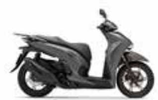
Mat Rock Gray Novinka · Special Edition