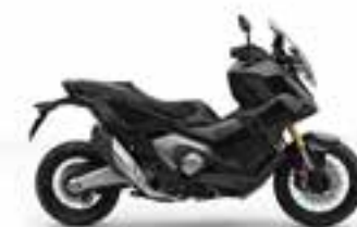
Graphite Black Novinka