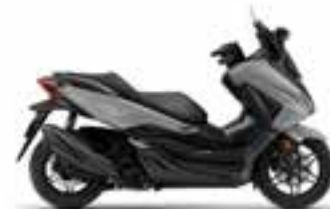
Pearl Falcon Gray Novinka