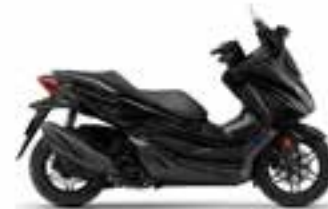
Pearl Nightstar Black Novinka