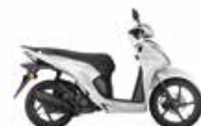
Pearl Jasmine White