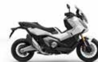
Pearl Glare White Novinka