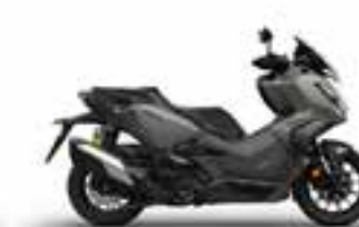
Mat Ruthenium Silver Metallic Novinka