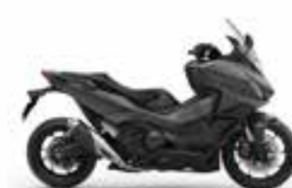
Iridium Gray Metallic Novinka