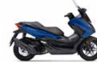
Mat Pearl Pacific Blue Novinka