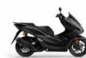
Mat Galaxy Black Metallic Novinka