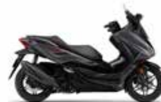
Mat Cynos Gray Metallic Novinka - Special Edition