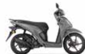
Pearl Jupiter Gray