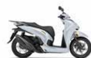
Pearl Nebbia White Novinka