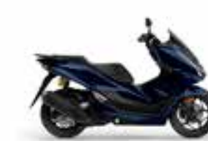
Pearl Darl Ash Blue 2 Novinka