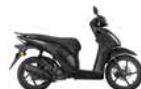
Mat Galaxy Black Metallic