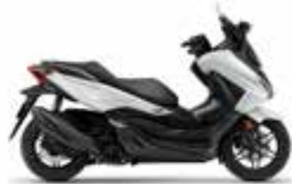
Mat Pearl Cool White Novinka