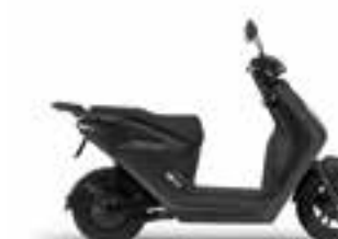
Mat Ballistic Black Metallic