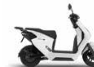
Pearl Sunbeam White