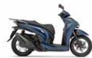
Mat Jeans Blue Metallic Novinka