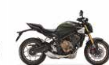
Mat Laurel Green Metallic