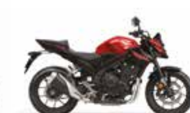
Grand Prix Red