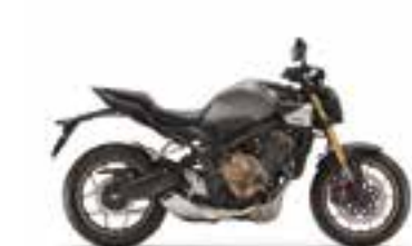
Pearl Smoky Gray