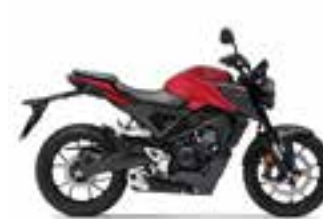
Pearl Splendor Red