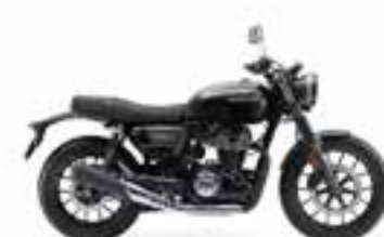
Gunmetal Black Metallic Novinka