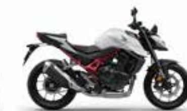
Mat Pearl Glare White Novinka