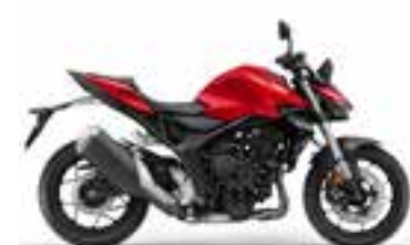
Grand Prix Red Novinka