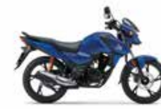
Mat Marvel Blue Metallic