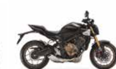
Mat Gunpowder Black Metallic