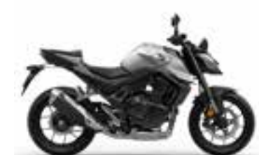
Digital Silver Metallic Novinka