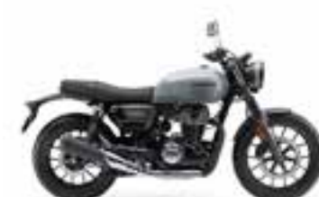
Pearl Deep Mud Gray Novinka