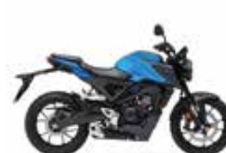
Reef Sea Blue Metallic