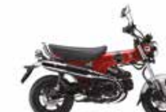
Pearl Nebula Red