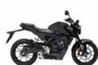
Mat Cynos Gray Metallic