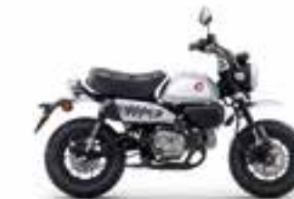
Pearl Shining Black