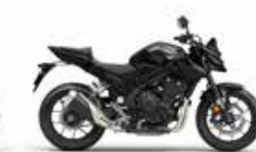
Mat Gunpowder Black Metallic