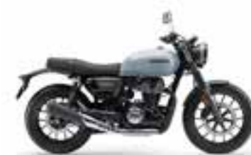
Puco Blue Novinka