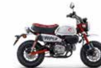
Pearl Nebula Red