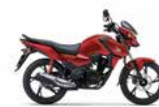
Imperial Red Metallic