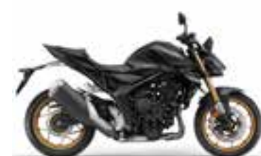
Mat Ballistic Black Metallic Novinka