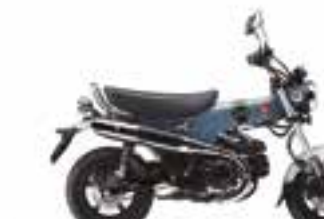
Pearl Cadet Gray