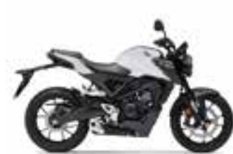
Pearl Cool White