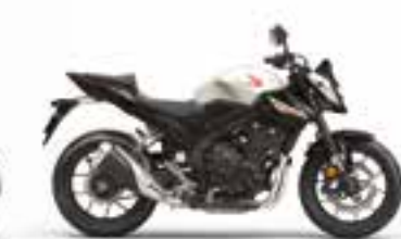
Pearl Himalayas White