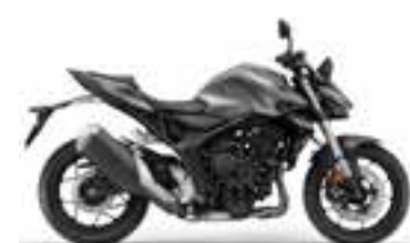
Mat Iridium Gray Metallic Novinka