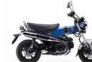
Pearl Glittering Blue