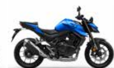
Glint Wave Blue Metallic Novinka