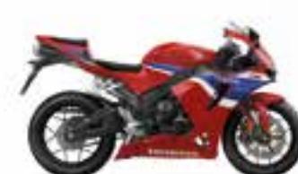
Grand Prix Red