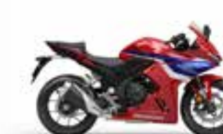
Grand Prix Red