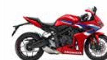
Grand Prix Red